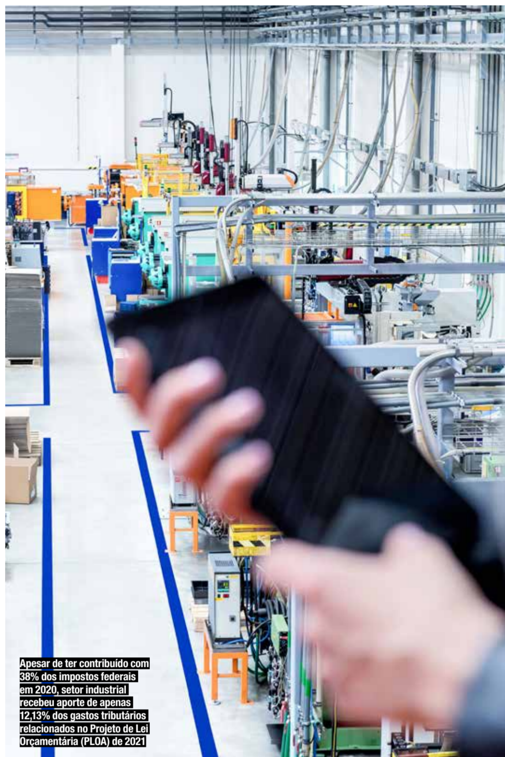
Apesar de ter contribuído com 38% dos impostos federais em 2020, setor industrial recebeu aporte de apenas 12,13% dos gastos tributários relacionados no Projeto de Lei Orçamentária (PLOA) de 2021