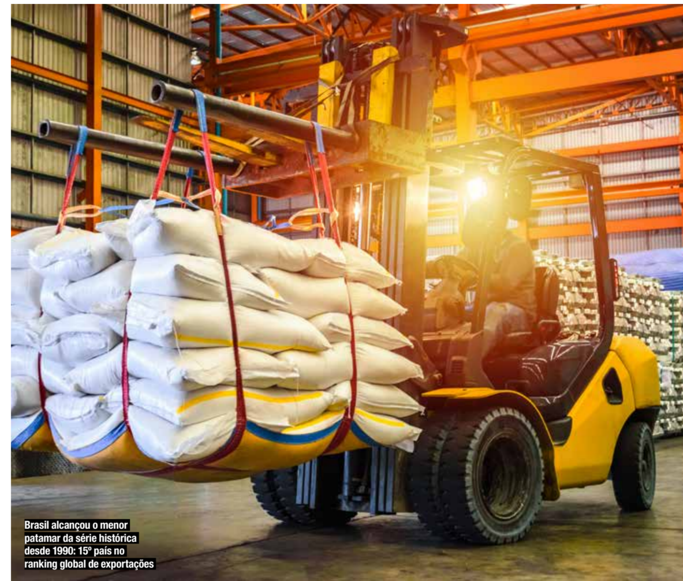
Brasil alcançou o menor patamar da série histórica desde 1990: 15º país no ranking global de exportações

O plano recomenda a aprovação de acordos internacionais em tramitação no Congresso Nacional, incluindo o Acordo de Facilitação de Comércio do Mercosul (MSC 512/2020 e PDL 164/2022), o Acordo para a Proteção Mútua das Indicações Geográficas do Mercosul (MSC 601/2020 e PDL 165/2022), o Protocolo de Contratações Públicas do Mercosul (MSC 599/2018 e PDL 928/2021) e o Protocolo de Serviços Mercosul - Colômbia