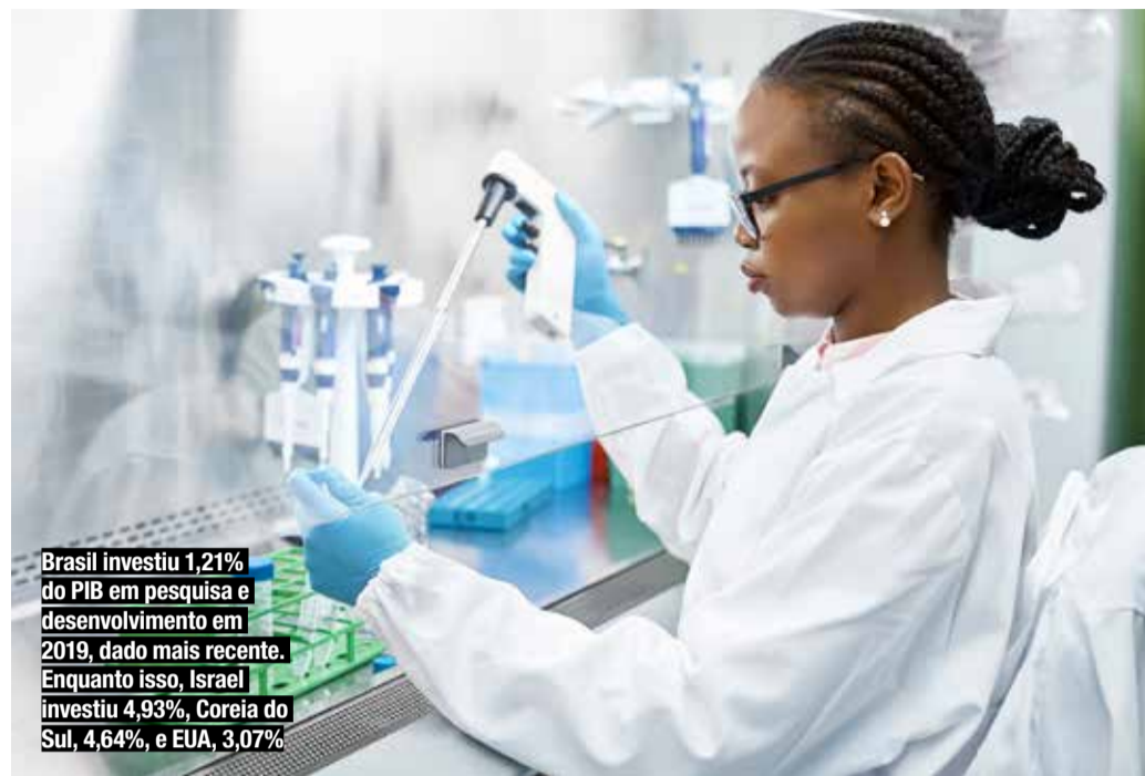
Brasil investiu 1,21% do PIB em pesquisa e desenvolvimento em 2019, dado mais recente. Enquanto isso, Israel investiu 4,93%, Coreia do Sul, 4,64%, e EUA, 3,07%