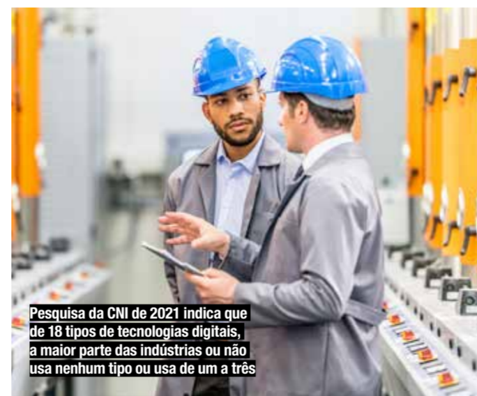
Pesquisa da CNI de 2021 indica que de 18 tipos de tecnologias digitais, a maior parte das indústrias ou não usa nenhum tipo ou usa de um a três

As linhas de financiamento também podem ser melhoradas, sendo importantes sobretudo para pequenas e médias empresas, ela argumenta. “O